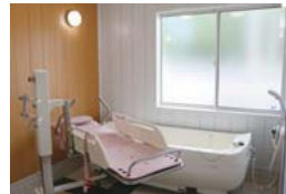
POINT② 要介護の方も安心して入浴可能な特殊機械浴槽を完備。