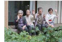
POINT② 農園で野菜作り。今年はジャガイモ、ナス、キュウリ、ニラを栽培。