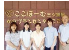
1.利用者の自宅まで訪問介護。今日も元気についてきます! 2.サービス付き高齢者向け住宅への訪問介護。生活の不安を支えます。3.訪問看護ステーション。居宅介護支援事業所、在宅介護支援センターが併設しており、介護相談もできる。