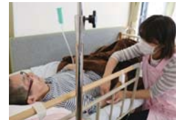
POINT① 日中は看護職員が常駐し、医療ニーズにも対応。

1600通り以上の言葉を話す人形が大人気で、利用者は毎日しゃべったり、歌ったり人形を通じて職員とのコミュニケーションを楽しんでいる。「一緒に過ごすることで、一生懸命子育てをした若い頃を思い出す、とおっしゃる利用者様も多いです。会話をすることで認知症の予防にも期待しています。」(管理者)。