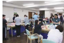
POINT③ 技術向上のための研修を会社全体でサポート。

日中は看護職員が常駐しており、胃ろうや在宅酸素、インスリンの対応など医療的な管理が必要な利用者の受け入れもしている。「急な体調不良にも対応可能です。医療的な処置があるために、自宅で生活することが難しい方も、お気軽にご相談ください。」(管理者)。