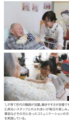
1.子育て時代の職員が活躍。働きやすさが自慢です！ 2.明るいスタッフとのふれあいが毎日の楽しみ。3. 単独などその方に合ったコミュニケーションの方法を実践している。