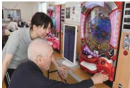
POINT① カラオケやパチンコなどレクリエーションが充実。

職員一人ひとりの介護技術のレベルアップができるように定期的に研修の場を設けている。「利用者様により質の高いサービスを提供するために、日々研修を計画しています。未経験の方や、ブランクのある方でも安心して技術取得を図れる環境です。」(管理者)。