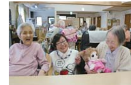
POINT③ 子育て時代を思い出して会話が弾む。言葉を話す人形が大人気！